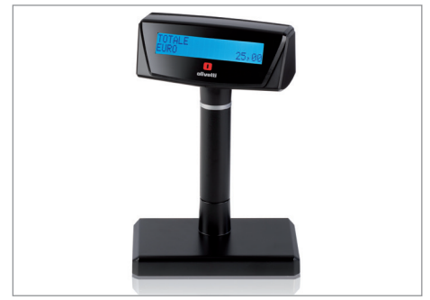
Display alfanumerico mono e bifaccia